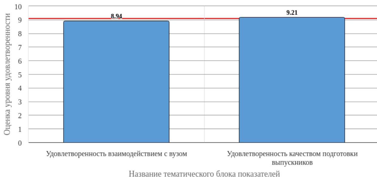
Рисунок 2.1 - Средняя оценка удовлетворенности (по тематическим блокам показателей)

Средняя оценка удовлетворенности респондентов по блоку вопросов «Удовлетворенность взаимодействием с вузом» равна 8.94, что является показателем высокого уровня удовлетворенности (75-100%).